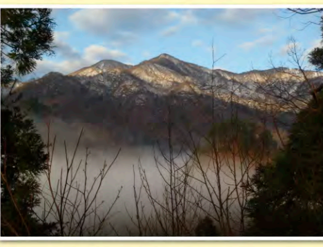
展望台から望む五頭連峰