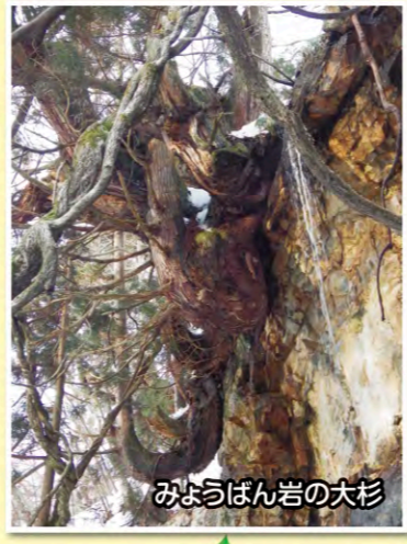
みょうばん岩の大杉