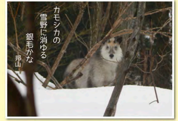
コナラの森のカモシカ