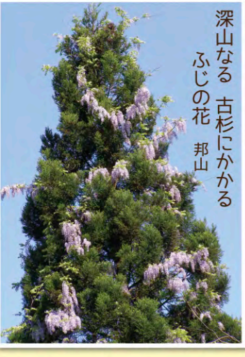
深山なる古杉にかかる ふじの花 邦山