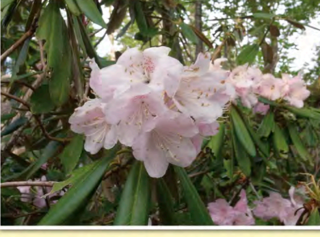
展望台シャクナゲ平のシャクナゲ